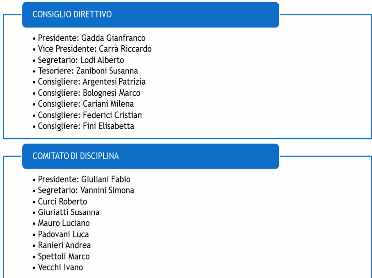
Figura 2 - Organigramma del Consiglio dell'Ordine dei Dottori Commercialisti e degli Esperti Contabili di Ferrara

L'Ordine si avvale del supporto della Fondazione dei Dottori Commercialisti e degli Esperti Contabili di Ferrara, che può qualificarsi come un ente di diritto privato costituito su iniziativa del Consiglio dell'Ordine di Ferrara in data 05/07/2002 e regolato da un proprio Statuto; la Fondazione svolge servizi di supporto nella preparazione dei praticanti e nel successivo aggiornamento professionale degli iscritti, nella divulgazione editoriale di pubblicazioni in materia economica, giuridica e tributaria, nella promozione di dibattiti e convegni culturali e scientifici sulle materie più propriamente professionali e nella sovvenzione di borse di studio per agevolare l'inserimento professionale di giovani promettenti. La Fondazione ha sede in Ferrara, presso i locali dell'Ordine dei Dottori Commercialisti ed Esperti Contabili. Sono organi della